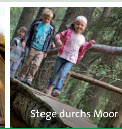
Stege durchs Moor