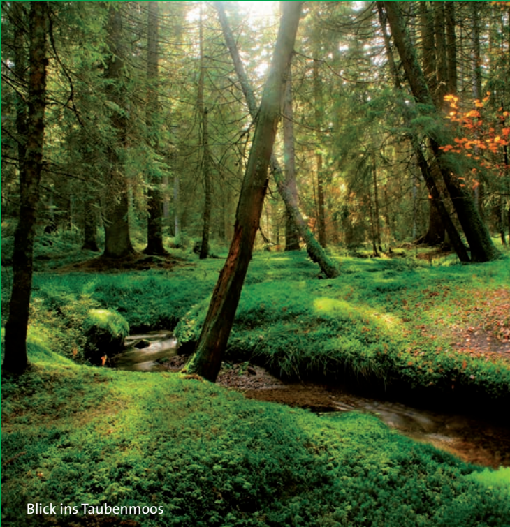
Blick ins Taubenmoos