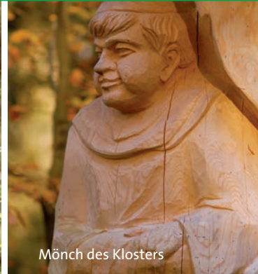
Mönch des Klosters